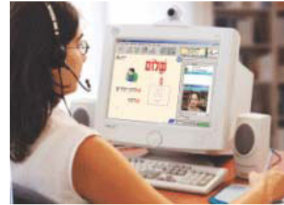
מורה של eTeacher בזמן העברת השיעור

תכנית הלימודים מיושמת מזה 3 שנים במסגרת פרויקט ראשון מסוגו בעולם במשרד החוץ הישראלי. במסגרת הפרויקט לומדים כל ילדי הדיפלומטים של מדינת ישראל עברית דרך האינטרנט. למעלה מ 300 תלמידים ב-50 מדינות שונות לומדים איתנו היום. התוכנית מאפשרת היום לכל מי שמעוניין ללמוד עברית לקבל את המורים הכי טובים, עם התכנים ושיטות הלימוד המתקדמות ביותר אצלכם בבית בכל מקום בעולם.