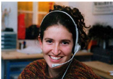
סט האוזניות והמקרפון באמצעותם נעשית התקשורת