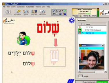
הכיתה הוירטואלית באמצעותה מתקיים השיעור