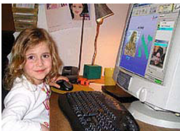
תלמידה בזמן שיעור עברית