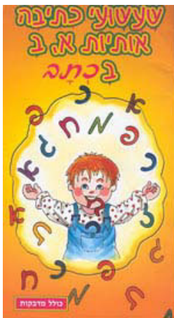
ספרות מלווה לקורס בהוצאת צבר